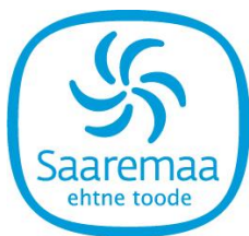
Joonis 3. Saaremaa ehtsa toote märgis