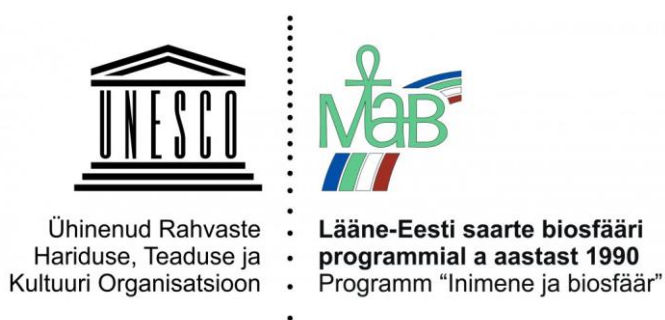
Joonis 2. UNESCO ja Lääne-Eesti saarte biosfääri programmiala logod

Lääne-Eesti saarte programmiala logo on toodud joonisel 2.